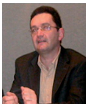
Par Emmanuel EVENO Président de Villes Internet, Géographe, Chercheur au LISST CIEU

L'évaluation des Labels porte sur l'exploitation d'un vaste questionnaire que les villes candidates remplissent en ligne ainsi que sur les notes obtenues par des visites réalisées sur les sites Web des collectivités.